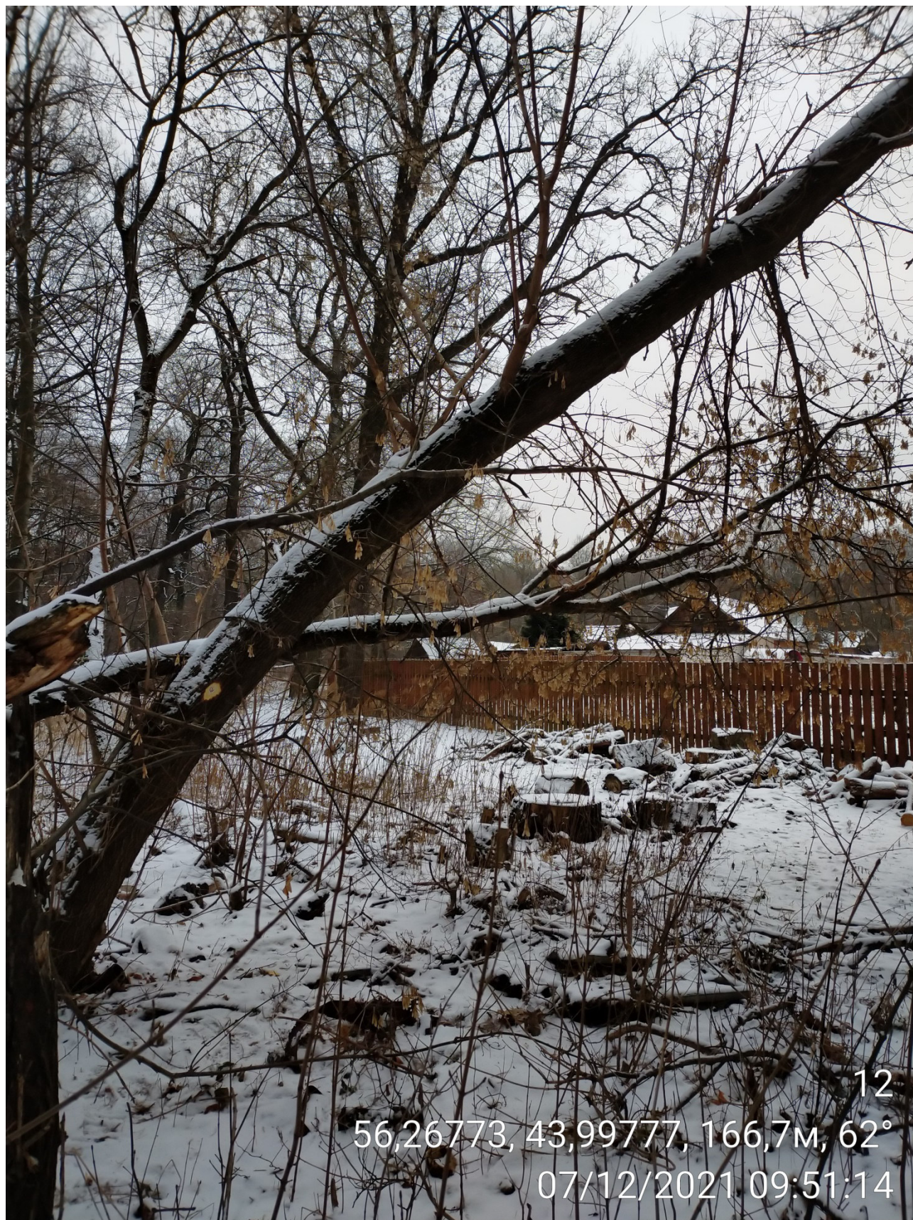
Дерево № 12